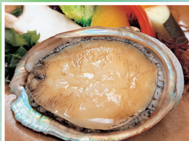
「活アワビの踊り焼き」80g～香草バターソース～